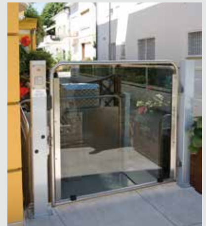
Versión de acero inoxidable (opcional)