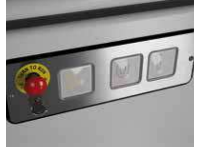
Botonera de piso Silver