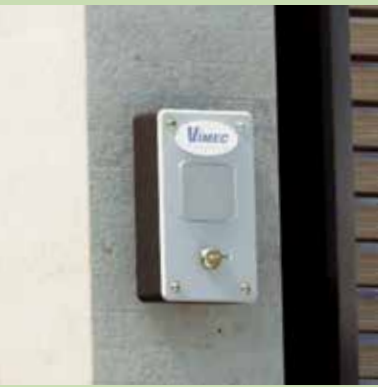
Botonera interna 50X50 mm - Silver