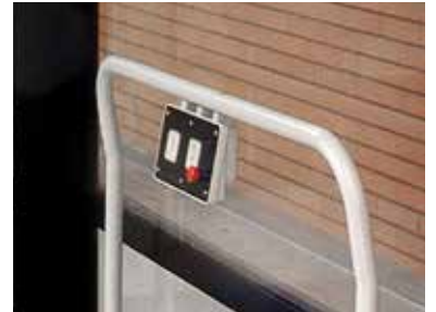
Botonera de piso Steppy

Steppy es la plataforma elevadora con soluciones técnicas y estéticas que la hacen la preferida de los instaladores italianos; mecánica hidráulica, protecciones en chapa o policarbonato gris para mejorar su design e impacto estético, mandos en máquina y pared y radiomando, hacen de Steppy una de las líderes en su segmento.