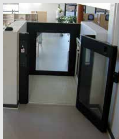
Steppy con puerta y cancela automáticas